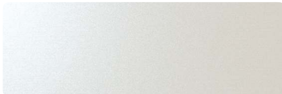
Silver Nacre / BP 1600